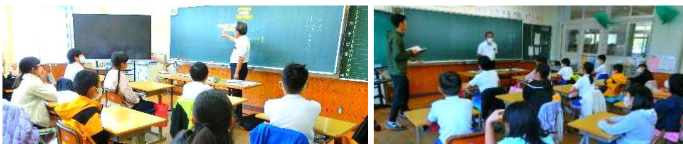
「石引き」「落書きする」「悪口をいう」など、軽率な行動が罪になることを学びました。「わるいこと」をすれば、家族が悲しみ、周りの人には迷惑がかかること、それを防ぐために「心のブレーキ」をかけることを教えていただきました。