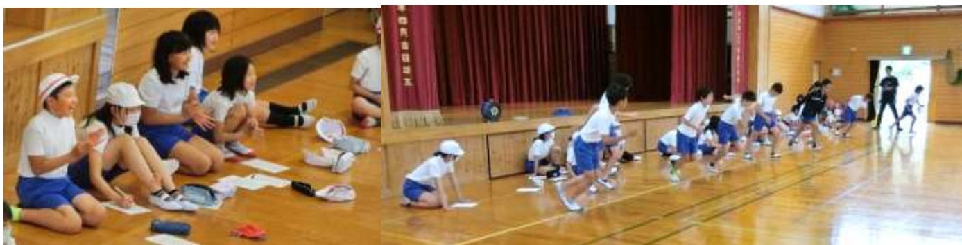
しっかり走って、しっかり応援して、みんなとても頑張っていました！