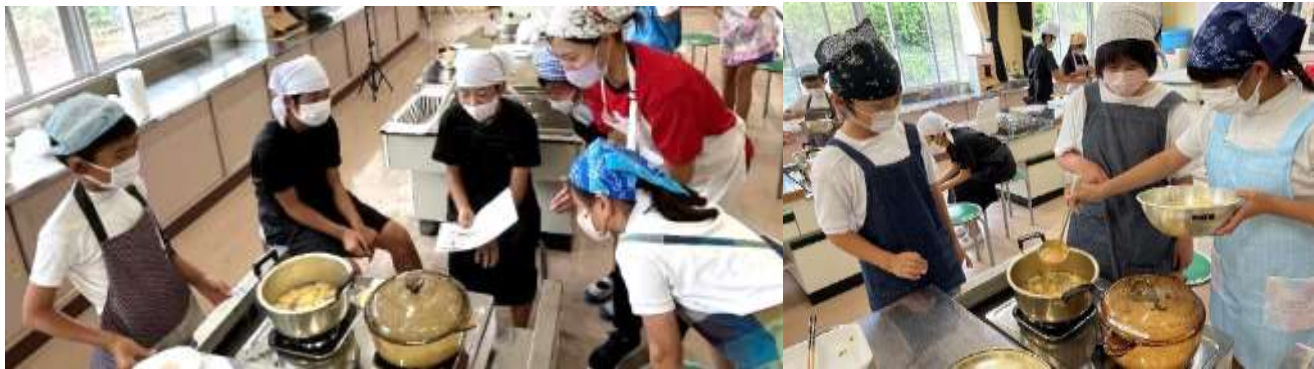
9月21日(木) 家庭科「調理実習」

芸術の秋！！ はりがねを、手やペンチで上手に曲げながら、作品をつくっています。 どんな芸術作品ができあがるのか、たのしみです。