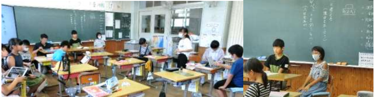
7月7日(金) ももの学習 「ももの皮むき、ももサイダー」